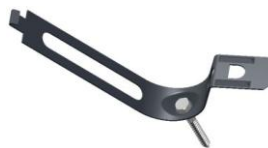
Rørklemme m/skru og murplugg